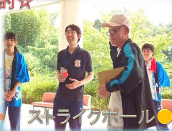
ストライクボール●