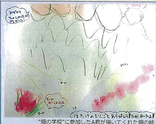
“煙の学校”に参加したA君が描いてくれた煙の絵